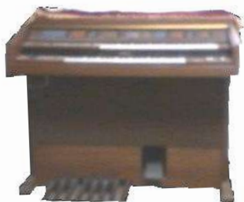
ヤマハエレクトーン 1台 モデル：FE-50 SERNo.043475

※古い型ですが大切に使用して下さる方におゆずりします。提供者が配送の予定ですが、ご相談ください。