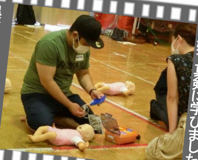
万が一の時に備えて夫婦で真剣に学びました