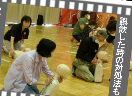
誤飲した時の対処法も