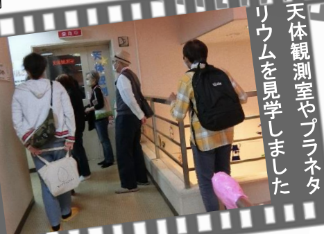
天体観測室やプラネタリウムを見学しました