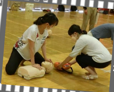
心肺蘇生法とAEDの実習をしました