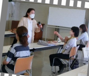
活動前に大切なことを8講座16時間学びます