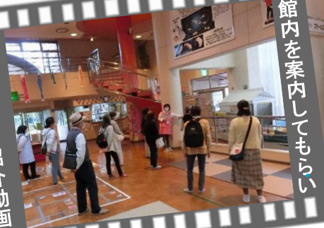
館内を案内してもらい