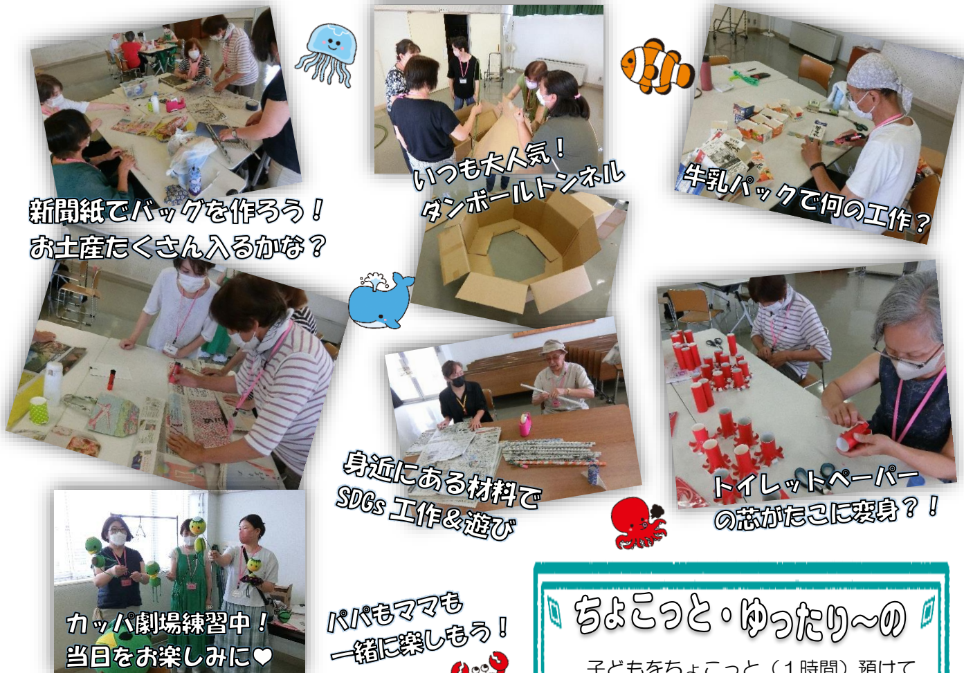
新聞紙でバッグを作ろう! お土産たくさん入るかな?

『帰ってきたぞ!ファミサポまつり2023』今年はいつものファミサポまつりが復活します! 提供会員さん達と一緒にわいわい楽しく準備をスタートしました。今年はたくさんの子供達笑顔に出会えるかな?みんなでアイデアを出しながら、手作りの温かいおまつりになるよう頑張ります!