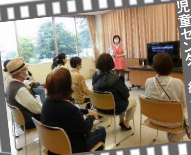
児童センター紹介動画