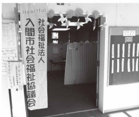
やまゆり荘にて相談会

ボランティアセンター出張相談、ホームスタートいるまのおしゃべり会と合同でやまゆり荘で開催しました。