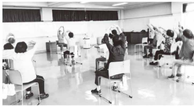
サロン「ワイワイなかま」