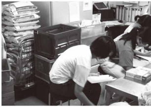
フードバンクいるま

毎年度夏休み期間中に実施しているボランティア体験プログラム事業です。フードバンクでのボランティア体験等17のメニューに中学生・高校生を中心にのべ164人が参加しました。