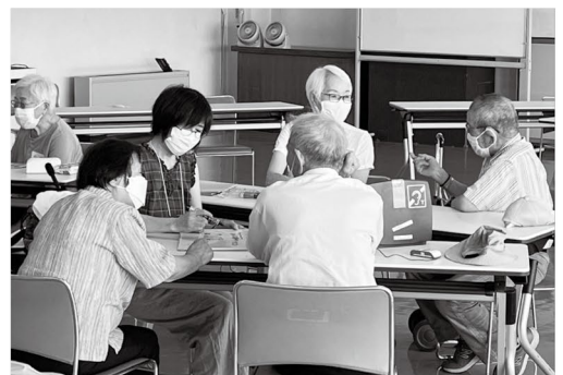
耳の聞こえにくい方のサロンの様子

交流の場をできるだけ絶やさないように工夫を凝らし、コロナ禍が収束に向かった際には、さまざまな交流の場が活性化することを期待します。