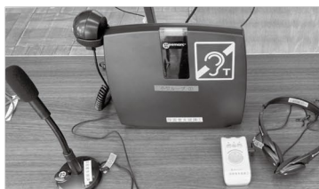
小型ヒアリンググループ

聞こえを試してみたい方は、日時をご予約のうえ黒須事業所2階の意思疎通支援者派遣事務所までおこしください。