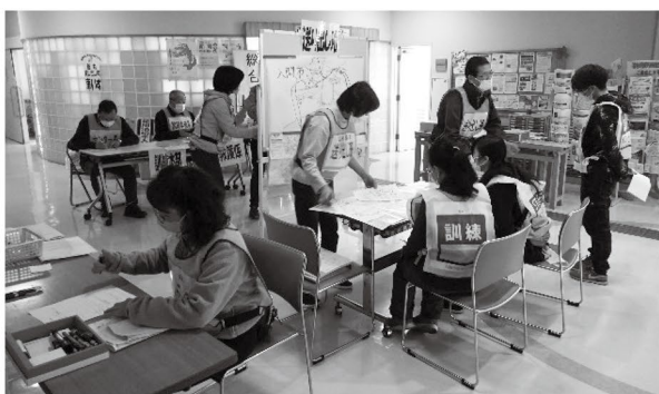
写真は昨年度の様子です。