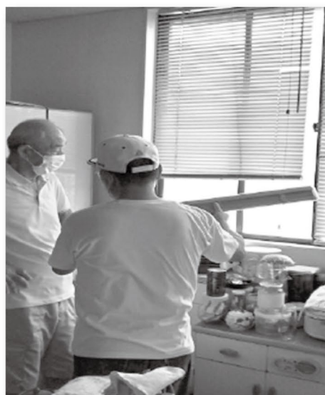
【ブラインドの交換】

事務局（藤沢公民館） 毎週火曜日 午後1時00分～午後3時30分 070-4135-9994