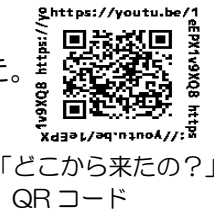
「どこから来たの？」QRコード