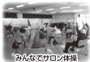
みんなでサロン体験