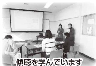
傾聴を学んでいます

未就学児を子育て中の家庭を先輩ママのボランティアが訪問し、一緒に育児、家事などを行うことで子育て家庭が孤立しないよう活動しました。