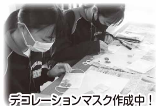
DIYマスキング作成中！