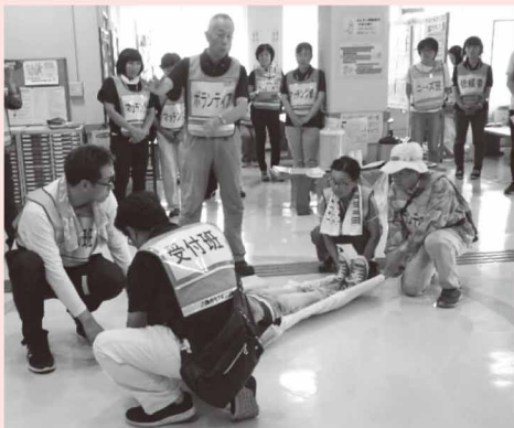
写真は一昨年度の様子です