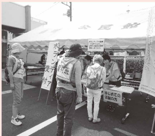
★災害ボランティアセンター運営訓練：ボランティア受付の様子です (一昨年度)

2日目は入間市社会福祉協議会が実施する 災害ボランティアセンター運営訓練 に参加し、運営スタッフを体験します。