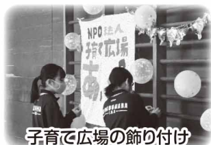
子育て広場の飾り付け

ボランティア活動に参加するきっかけづくりとして、施設・団体等の協力を得て実施しました。