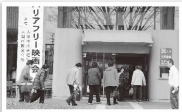
バリアフリー映画会 7月4日(日)