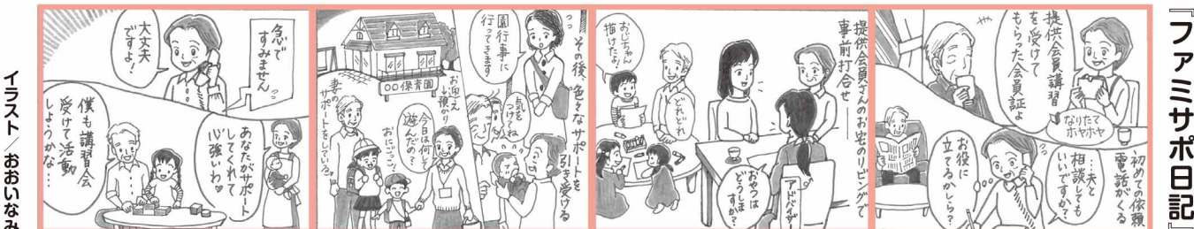
イラスト/おおいなみ

※活動の様子や講習会の日程等詳細は、社協のホームページよりファミサポをクリック！