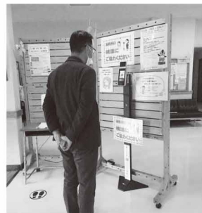
市民活動センター 正面入口に 設置しました

令和3年2月5日、いるま野農業協同組合様より、センサーによる体温測定とマスクの装着を確認する体温測定器を2台ご寄贈いただきました。ご寄贈いただいた体温測定器は市民活動センターに設置するとともに、入間市社会福祉協議会の事業にて活用させていただきます。予定で。