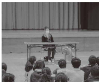
仏子小学校4学年の福祉教育 ～盲導犬ユーザーからのお話～