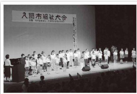
入間市福祉大会 8月7日(土)

今後とも、皆さまとともに地域に密着した活動を積極的に展開してまいりますので、一層のご支援とご協力をお願いいたします。