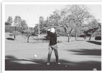
チャリティーゴルフ大会 11月8日(月)