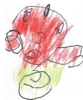
F. K 作

〒358-0023 入間市扇台 2-7-26 TEL：04-2962-5308 FAX：04-2962-5458 E-mail：ougidai@ictv.ne.jp