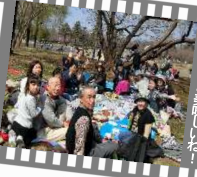
皆で食べる美味しいね!