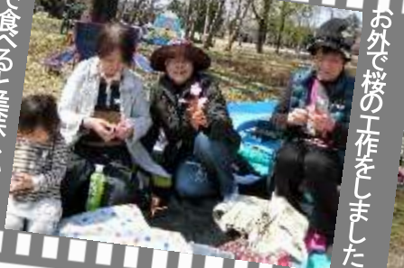
お外で桜の工作をしました