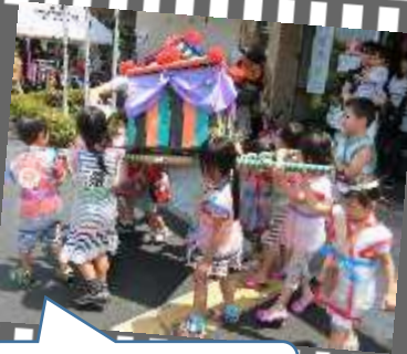
手作りのおみこしがつき