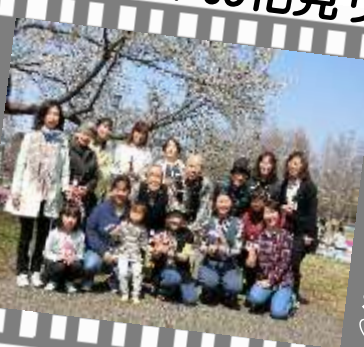
お天気で良かったね♡