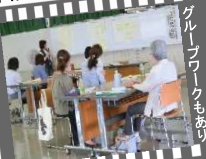
グループワークもあり