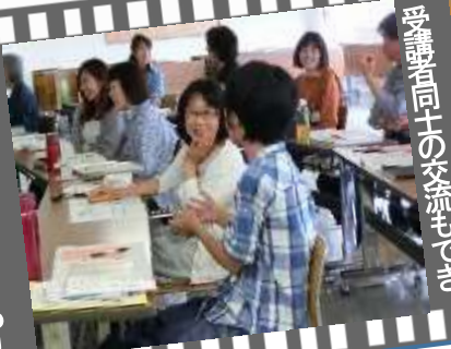
受講者同士の交流もでき