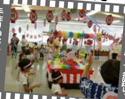
やぐらの周りで盆踊り