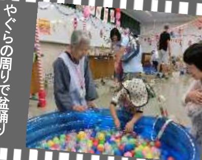
屋敷がいっぱい!夏祭り