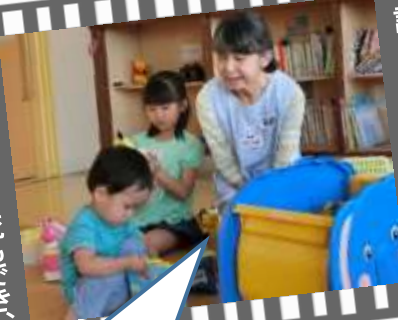
託児の講習会でした