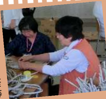
新聞紙バックを丁寧に作成