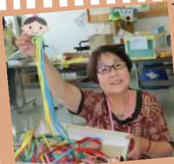
すてきな七夕飾りが沢山