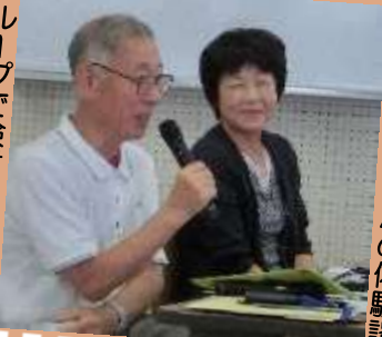
現提供会員さんの体験談