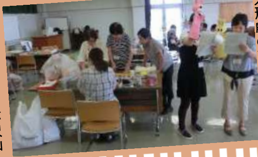
人形劇の練習や工作等