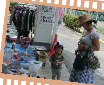
子ども用品あるかな?