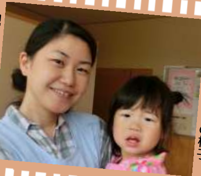
講習会中の保育の様子