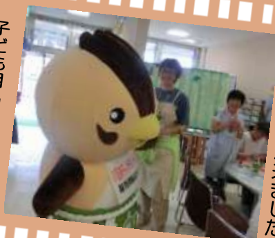
いるティーが来ました