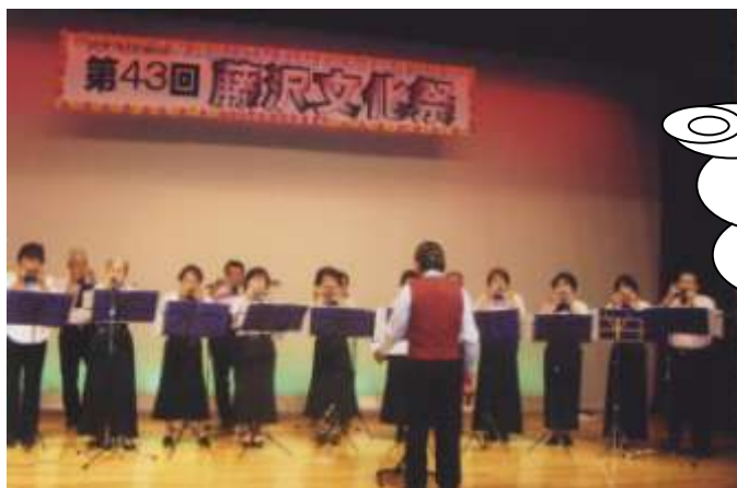
藤沢公民館・文化祭での様子