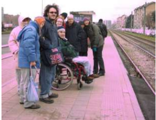
ディサービス・ランコラの「買い物に行く活動」中、路面電 車を待っているときの写真（2010年3月8日撮影）

現在は「黄金の絵画」というタイトルの有名絵 画盗難殺人事件の短編映画を進めています。