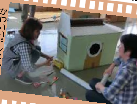
作業しながら話せばすむ