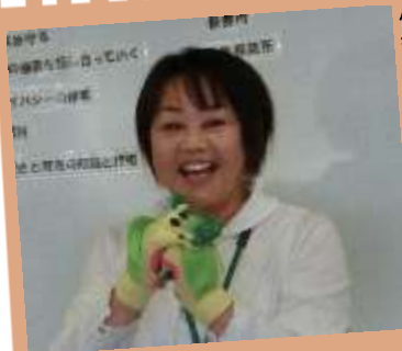
保育所長先生のとあそび