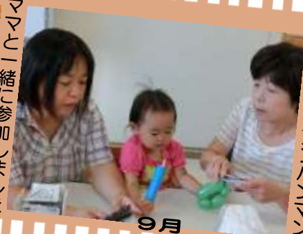
バルーンでアンパンマン