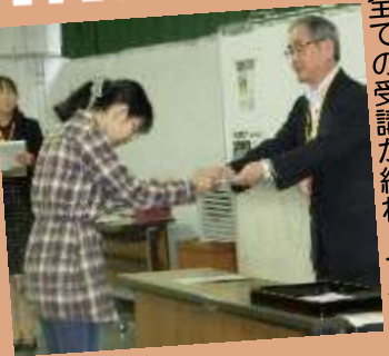
全ての受講が終わって登録