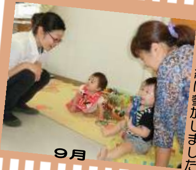
ママと一緒に参加しました