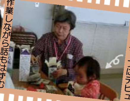
子どもスタッフにデビュー