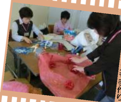
かわいいドレスも手作り