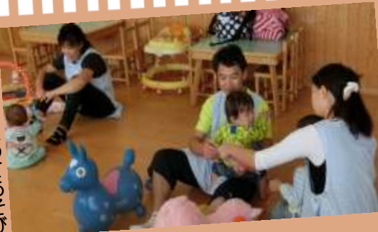
講習中の保育の様子