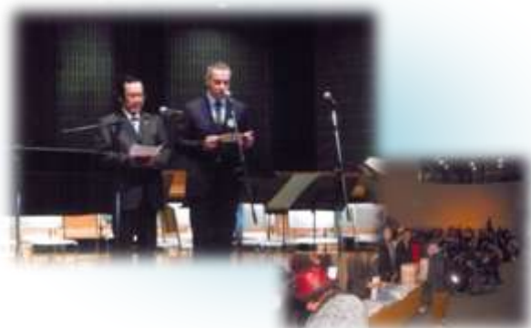
コンサート会場にはデンマーク大使も 急遽駆け付けてくれました

まだ冬のように寒い 4 月の福島で、朝から地元の中・高校生、大学生、先生方がボランティアをしてくださいました。会場ロビーでは入間市立藤沢東小学校の生徒さんからの応援メッセージが掲示され、また地元ミュージシャンによる演奏会も行われました。入場は無料でしたが、たくさんの義援金が集まりました。