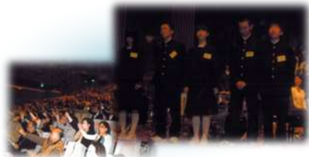
福島市第三中学の生徒さんによる宣言で 会場が一つになりました

日本国内外で活躍中の詩人、合亮一氏の詩の朗読をはじめ、このコンサートのために集まった私たち「オーケストラ」の演奏、東京から応援に駆け付けてくれた合唱団 120 名と地元福島の合唱団約 100 名による合同演奏が行われました。また、福島市第三中学の生徒さんによる「負けないぞ、福島！復興宣言」を参加者のみなさんと全員で唱和し、被災地の 1 日も早い復興を祈りました。そして入間市立藤沢東小学校の生徒さんからの応援メッセージが代読され、フィナーレでは会場全員で「ふるさと」を唄いました。